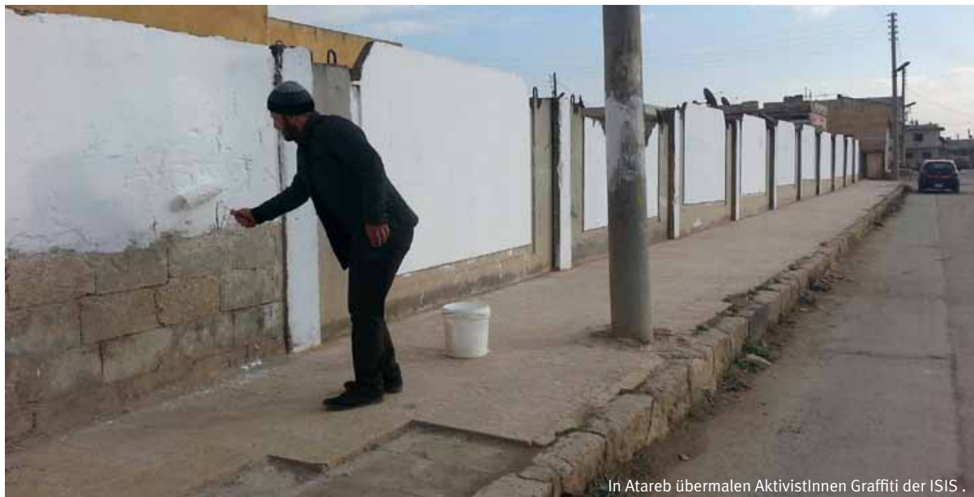
In Atareb übermalen AktivistInnen Graffiti der ISIS .