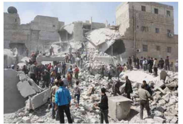
NACH EINEM LUFTANGRIFF AUF EIN WOHNHAUS IN ALEPPO SUCHEN ANWOHNERINNEN NACH TOTEN UND VERLETZTEN.