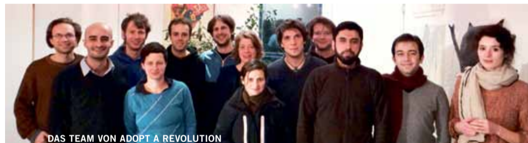
DAS TEAM VON ADOPT A REVOLUTION

Seit Ende 2011 unterstützt adopt a revolution die syrische Zivilgesellschaft in ihrem Aufstand gegen die Assad-Diktatur. Unsere Initiative möchte praktische Solidarität ermöglichen, die auf der großen Sympathie für die junge arabische Protestbewegung aufbaut. Durch die Übernahme von Revolutionspatenschaften können Menschen die Ziele des Aufstands in Syrien stärken, indem sie – nach Möglichkeit monatlich – finanziell zur Arbeit der zivilen Basisbewegung beitragen. Im Gegenzug bekommen sie regelmäßig Informationen über die Situation vor Ort, die wir in engem Kontakt mit den AktivistInnen sammeln. Rund 500.000 Euro von mehr als 2.300 Menschen sind auf diesem Weg schon für die zivile Aufstandsbewegung zusammengekommen, womit adopt a revolution