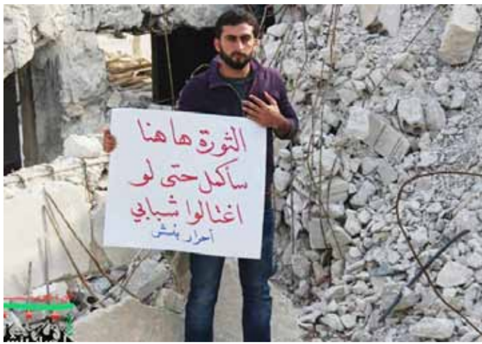
»DIE REVOLUTION IST IM HERZEN. ICH MACHE WEITER, AUCH WENN SIE MIR DIE JUGEND RAUBT.«