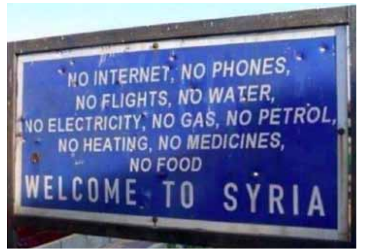
»WEDER INTERNET, TELEFON, FLÜGE, WASSER, STROM, GAS, BENZIN, HEIZUNG, MEDIZIN NOCH NAHRUNGSMITTEL - WILLKOMMEN IN SYRIEN.«