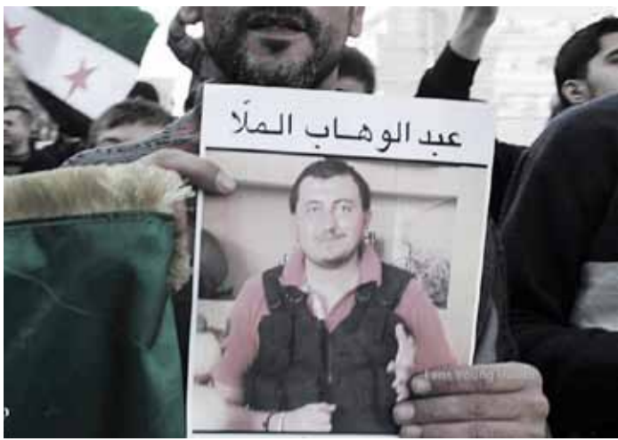
EINE DEMONSTRATION IN ALEPPO FORDERT DIE FREILASSUNG DES HÄFTLINGS ABDUL WAHAB AL MALLA, DER VON DSCHIHADISTEN VON ISLAMISCHER STAAT IM IRAK UND SYRIEN (ISIS) GEFANGENGEHALTEN WIRD.