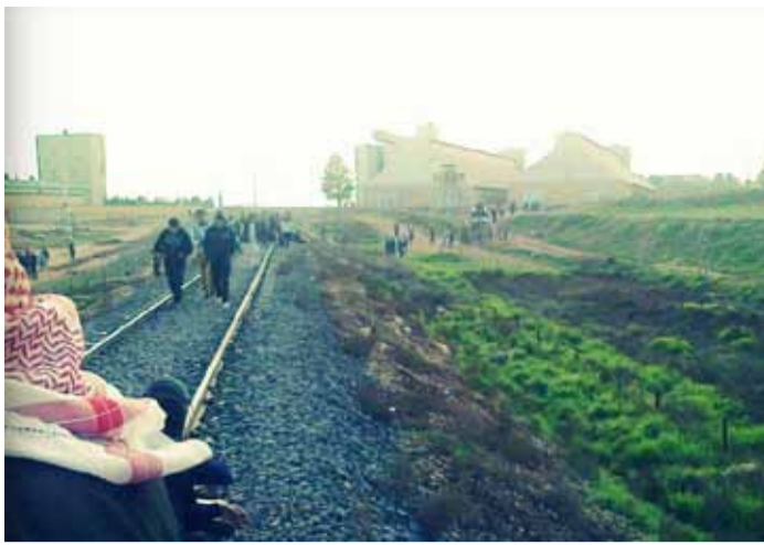
DAS AUSMASS DER HUMANITÄREN KATASTROPHE: VON 23 MILLIONEN SYRERIN- NEN SIND FAST 9 MILLIONEN AUF DER FLUCHT.